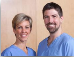
Centre d'implantologie dentaire Bernier, Delisle et Thériault

En 2002, le Consensus de McGill déclarait qu'une prothèse implanto-portée par deux implants à la mandibule devait constituer le standard de traitement pour les patients édentés. Les évidences scientifiques alors disponibles suggéraient que les prothèses complètes conventionnelles ne sont plus le premier traitement approprié. Cependant, le coût total d'un traitement d'une prothèse mandibulaire stabilisée par deux implants est certainement plus élevé qu'une prothèse conventionnelle. Toutefois, ce traitement devrait être accessible et abordable pour la population de gens édentés.